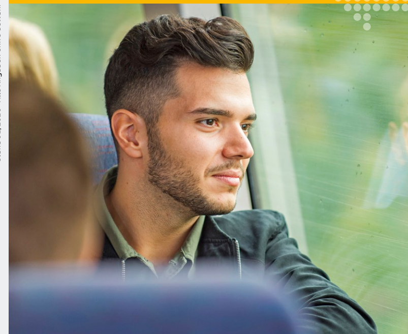
Stand 01/2020 · Alle Angaben ohne Gewähr